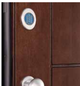
lato esterno (versione standard)