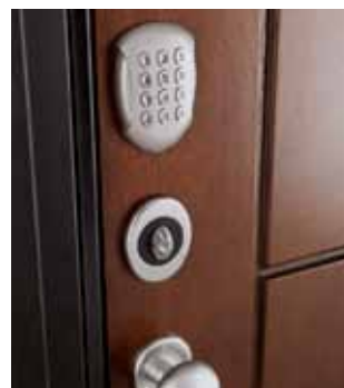
lato esterno con tastiera digitale extra e transponder aggiuntivo